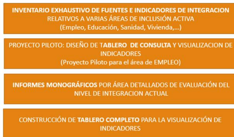
Gráfico 1. Etapas para la construcción del sistema de indicadores

La construcción del sistema de indicadores se llevará a cabo siguiendo las etapas que se muestran en el gráfico: