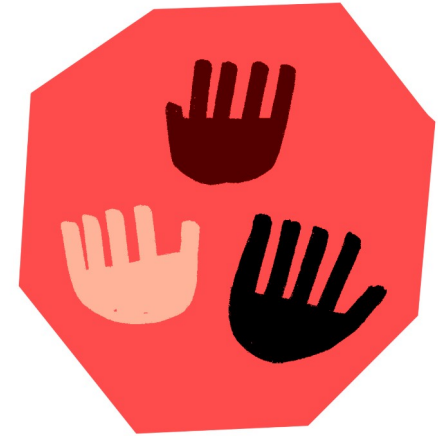
Antiracismo e interculturalidad